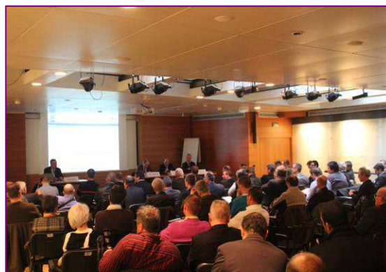
Vendredi 22 novembre : conférence de lancement pour la Certification CSSI

*Certification CSSI délivrée par CNPP Cert., organisme certificateur reconnu par les professionnels de la sécurité et de l'assurance. La marque de qualité pour les services dans le domaine de la prévention et de la protection.